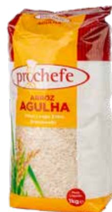
ARROZ Agulha Prochefe Formato > 12 x 1 kg