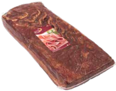
BACON Metades Formato > Peso Variável