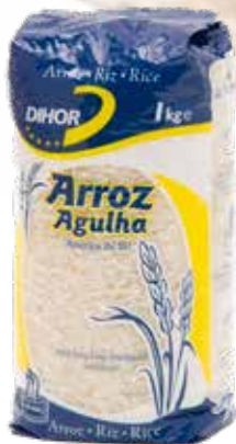
ARROZ Agulha Dihor Formato > 12 x 1 kg