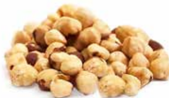
MIOLO DE AVELÂ