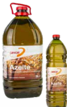
AZEITE Formatos > 6 x 3 L > 15 x 1 L