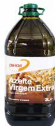
AZEITE VIRGEM EXTRA Formatos > 6 x 3 L > 15 x 1 L