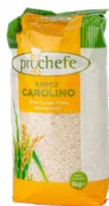
ARROZ Carolino Prochefe Formato > 12 x 1 kg