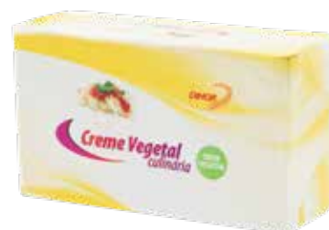
MARGARINA CULINÁRIA 100% Vegetal Formatos > 15 x 1 kg