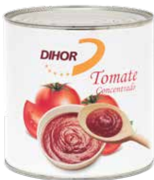
TOMATE Concentrado Formato > 6 x 3 kg