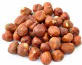
MIOLO DE AVELÂ