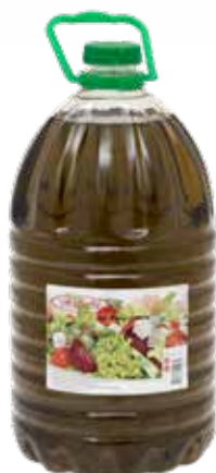
ÓLEO TEMPERO Formato > 3 x 5 L