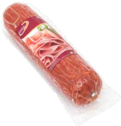
CHOURIÇÃO Formato > Peso Variável