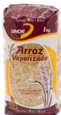
ARROZ Vaporizado Dihor Formato > 12 x 1 kg