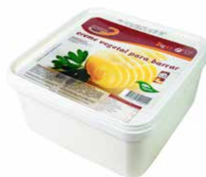
CREME VEGETAL BARRAR Formato > 6 x 2 kg