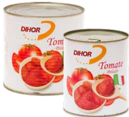
TOMATE Pelado Formatos > 12 x 1 kg > 6 x 3 kg