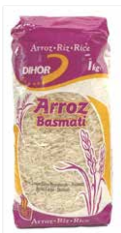
ARROZ Basmati Dihor Formato > 12 x 1 kg