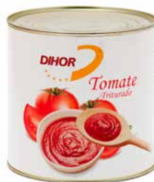
TOMATE Triturado Formato > 6 x 3 kg