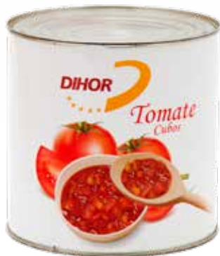
TOMATE Cubado Formato > 6 x 3 kg