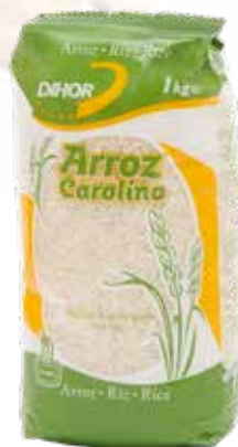
ARROZ Carolino Dihor Formato > 12 x 1 kg