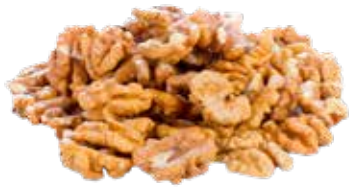
MIOLO DE NOZ