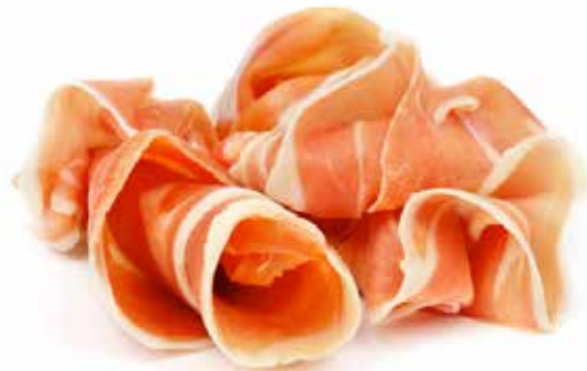
PRESUNTO Fatiado Formato > Peso Variável