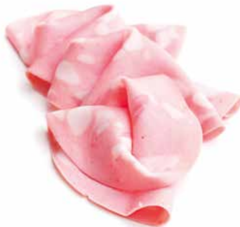
MORTADELA Formato > Peso Variável